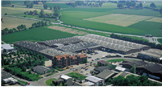
Firmengebäude der Firma HUPFER in Coesfeld