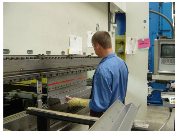
Abb.: Präzisionsarbeit mit modernstem Know-how werden Systemlösungen in Blech gefertigt

Mit GODYO P/4 erreicht die Fa. Karl Miller eine effizientere Planung der Fertigungsprozesse und schnellere Erfassung und Archivierung von Daten. Die Beschreibungen der schnelllebigsten Produkte stehen jederzeit zur Verfügung. Aktuelle Informationen aus der Konstruktion gehen direkt in die Fertigung.