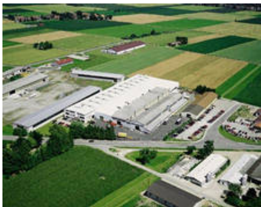
Abb. Karl Miller GmbH & Co. KG in Kirchberg – Luftaufnahme

Die Firma Karl Miller bietet Systemlösungen in Blech. Sie stellt High-Tech-Kabinen für Anwendungen wie Werkzeugmaschinenverkleidungen, Krankabinen, Maschinenhäuser und Sonderschaltschränke und vieles mehr her.