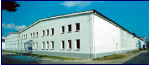
Abb. Firmengebäude der Sedlmayer GmbH in Triptis

Migration von PHOENIX P/2 auf GODYO P/4, das innovative und leistungsfähige Planungsinstrument für mittelständische Unternehmen.